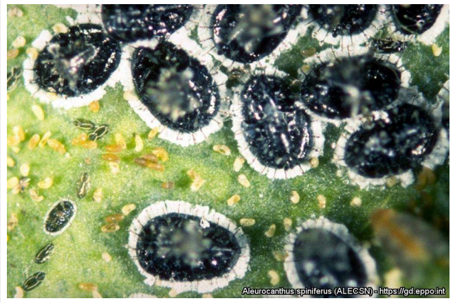
Ανήλικα άτομα και αβγά τού αλευρώδη Aleurocanthus spiniferus