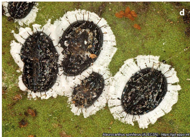
Ανήλικα άτομα τού αλευρώδη Aleurocanthus spiniferus