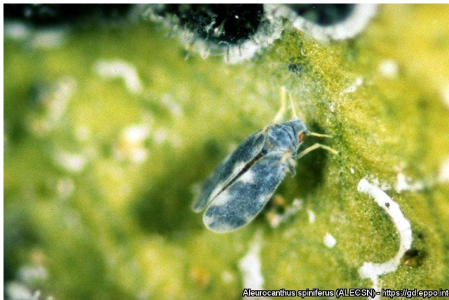
Ενήλικο άτομο τού αλευρώδη Aleurocanthus spiniferus