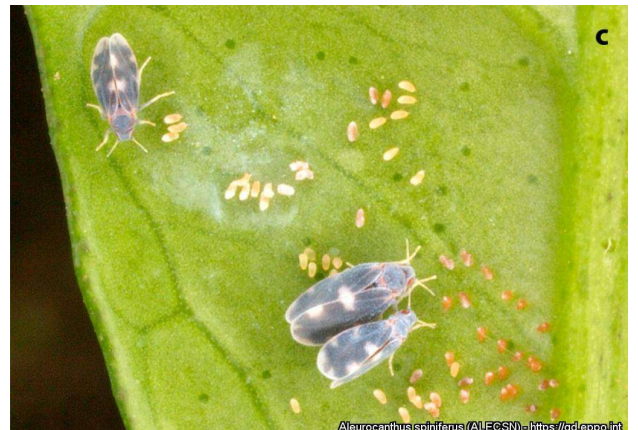
Ενήλικα άτομα και αβγά τού αλευρώδη Aleurocanthus spiniferus