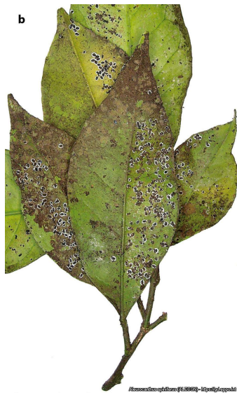
Συμπτώματα προσβολής σε εσπεριδοειδή τού αλευρώδη Aleurocanthus spiniferus